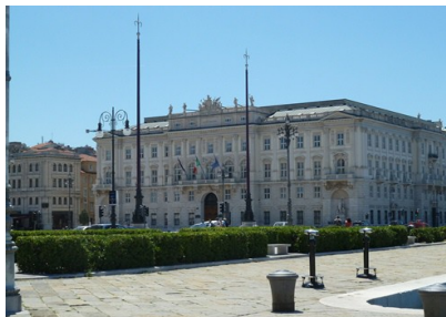
Palazzo ex Lloyd